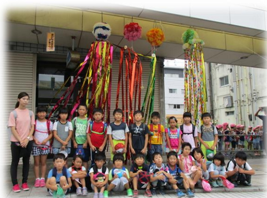
夏休み/七夕飾りコンクール出展・見学