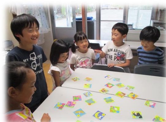
平日放課後/かるた遊び