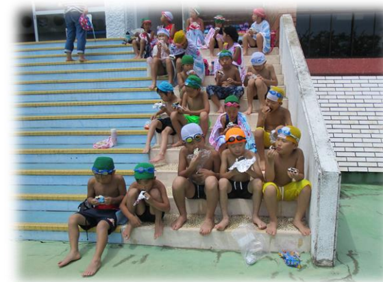
夏休み/園外保育（かみねプール）