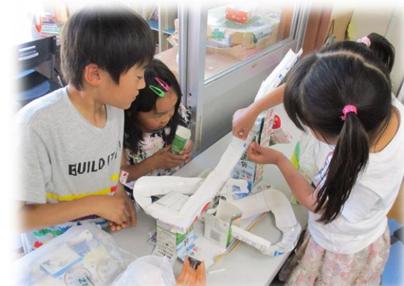
平日放課後/ピタゴラスイッチ作り