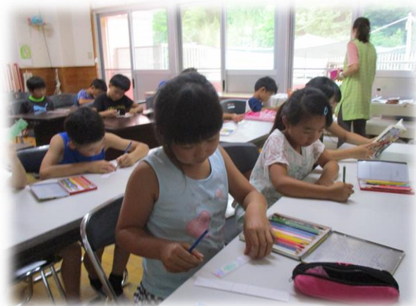
夏休み/学習の時間