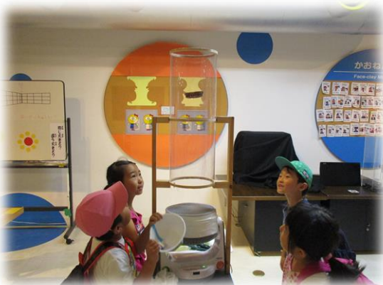
夏休み/園外保育（シビックセンター科学館）