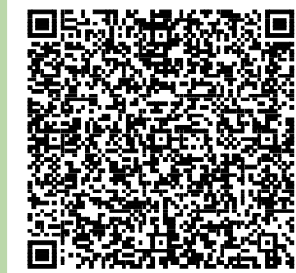
滑川聖徳保育園携帯コード