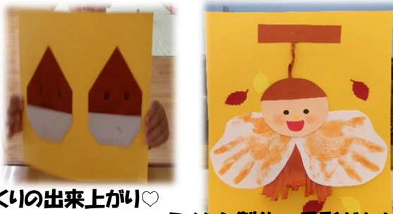
くいの出来上がり♡