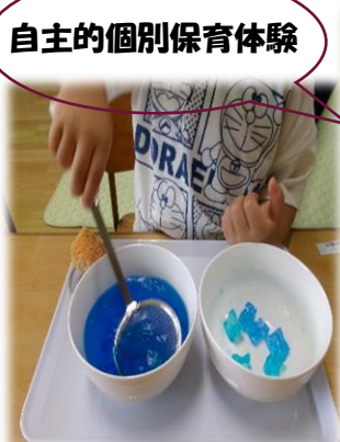
自主的個別保育体験