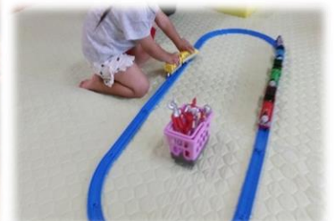
遊びにおいでよの日は自由におもちゃで遊びます♡