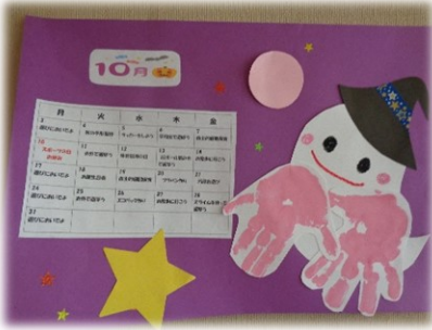
手形でカレンダー作り♡