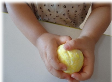
ぎゅっと力を入れて丸めます！

たくさんのお友達が遊びに来てくれたバスボール作り！ママからの「お風呂になかなか入ってくれなくて、...」とのお話しから、楽しい活動が出来ました！親子で協力してまんまるボールを作り大切にお持ち帰りをしました♡ご家庭でもぜひ作ってみてください！