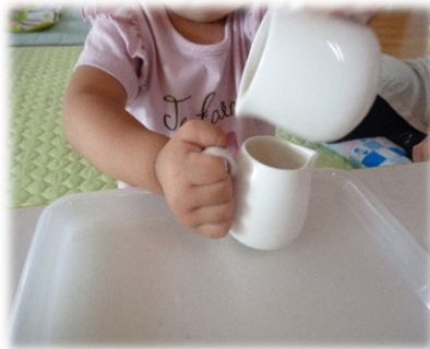
自主的個別保育、初体験♡