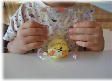
上手に出来上がったバスボール！ラッピングをしてお持ち帰り♡