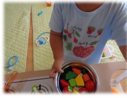
毎週月曜日は「遊びにおいでよ」の日です！