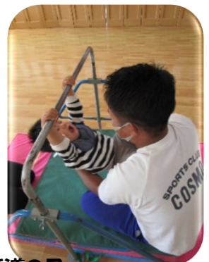
体育指導の日 熱血指導を受けました!