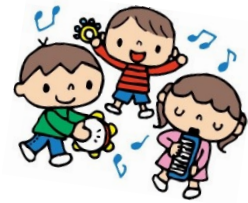
上手に楽器も鳴らせたね♪