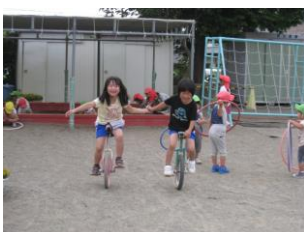
手を繋ぎ仲良く 乗っていました。