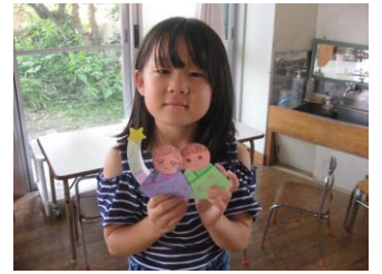
飾ってあるのを見て自分のあるかな？と嬉しそうに探していました。