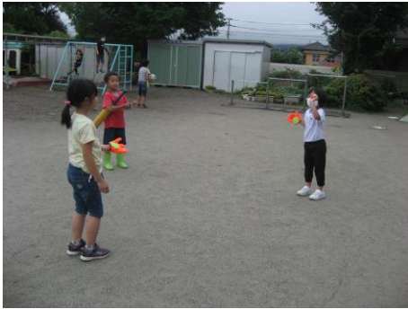
楽しくキャッチボール