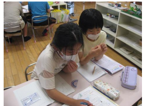
宿題や自主学習を集中して取り組んでいます