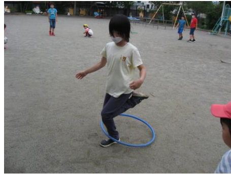
足で回すのに挑戦！上手に回せました