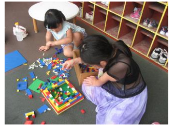
上手にカスタムシ描けました。園児のお友達と仲良くブロック。