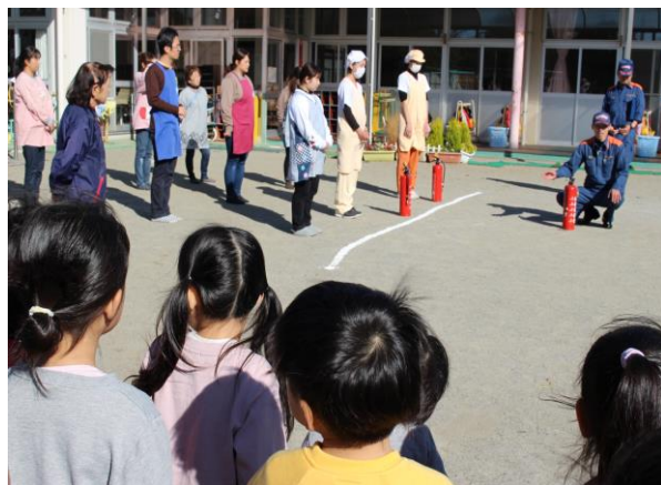
高萩消防署の方から、消火器の扱い方について指導を受けました。