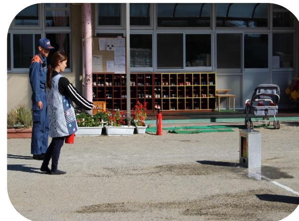
水消火器を使い、消火方法を実体験しました。