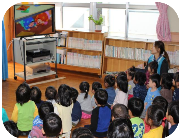
DVD「大地震が起きた！」を集中して見ている子ども達です。