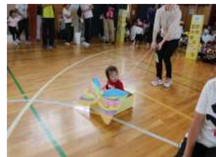
きれいなちょうちょになりました