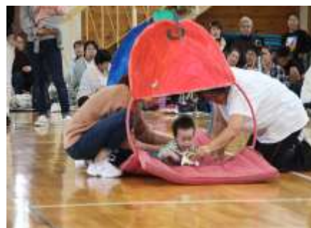
リンゴのトンネルをくぐったら