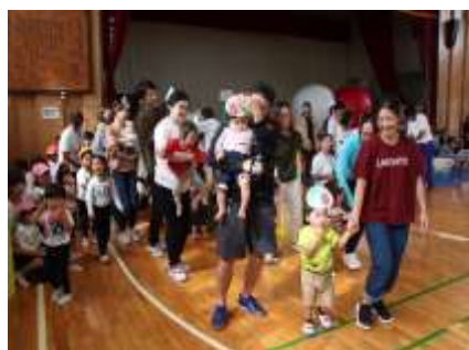
ちょっぴり緊張するね