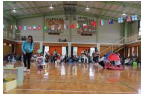
ママと一緒にがんばったよ！