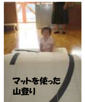
マットを使った山登り