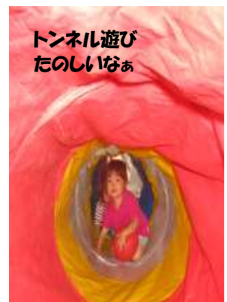
トンネル遊び たのしいなあ