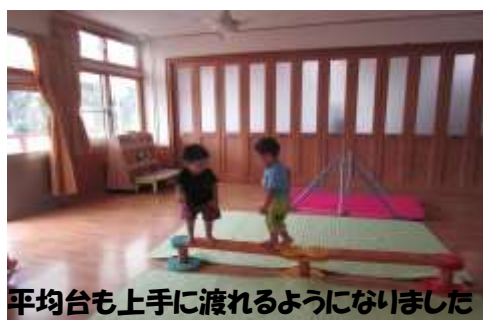
平均台も上手に渡れるようになりました

うんどう遊びでは、マットをよじ登ったり、平均台を渡ったり、体をたくさん動かして、遊びました♪運動会も、ばっちりですね！