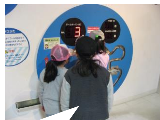
イライラ棒にチャレンジ!

(3月26日(火) シビックセンターにて) 科学館・プラネタリウムに行って、科学の不思議を体験してきました。プラネタリウムでは恐竜たちの迫力のある戦いに興奮したり、科学館では回転する展示物やスタンプ作りを楽しみました。