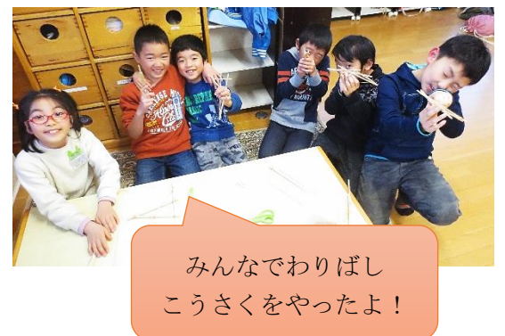
みんなでわりばし こうさくをやったよ!